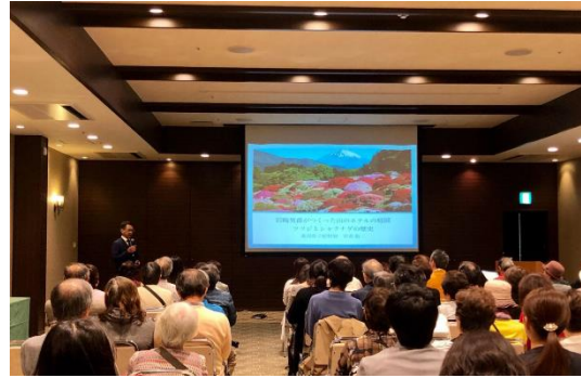
講演会の様子（イメージ）