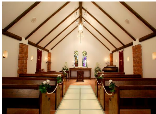
開催場所：“小田急 山のホテル”内 庭園のチャペル