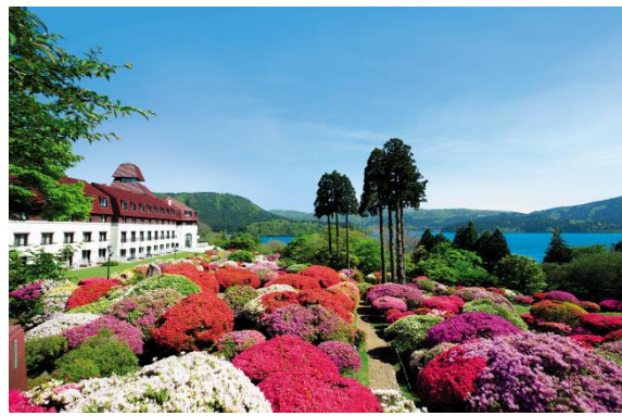
“小田急 山のホテル”のツツジ庭園と芦ノ湖