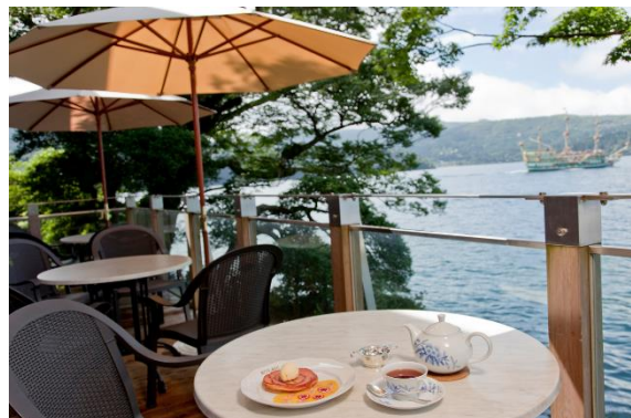
“サロン・ド・テ ロザージュ”のテラス席