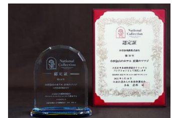
ツツジ認定時の日本植物園協会ナショナルコレクション認定証と認定盾