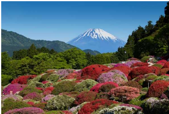
富士山を背景に咲き誇るツツジ

箱根・芦ノ湖畔に建つ“ 小田急 山のホテル ”は 4 月下旬から 「つつじ・しゃくなげフェア 2024」 を開催し、「後世に残すべき植物遺産」と認定を受けた 30 の古品種を含む 84 種類・約 3,000 株のツツジと、42 種類・約 300 株のシャクナゲが開花を迎える庭園をお楽しみいただけます。ここでは壮大な富士山や芦ノ湖をバックに、広大な庭園に色鮮やかなツツジが咲き誇る絢爛たる景色をご覧ください。庭園のツツジは 2022 年に 「日本植物園協会ナショナルコレクション第 10 号」 に認定され、昨年 3 月には、シャクナゲも 「日本植物園協会ナショナルコレクション第 15 号」 に認定されました。今年は、ツツジとシャクナゲがナショナルコレクションに認定されたことと、昨年、ホテルの開業 75 周年を迎えたことを記念して、庭園の歴史なども紹介するツツジ・シャクナゲの小冊子「小田急 山のホテル 庭園のツツジとシャクナゲ」を販売いたします。