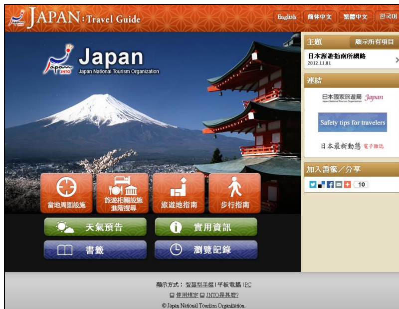
【タブレット向けサイト(中国語繁体字版)】